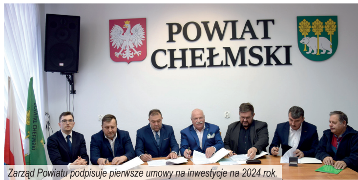
Zarząd Powiatu podpisuje pierwsze umowy na inwestycje na 2024 rok.

- To dla nas niezwykle cenne wyróżnienie. Oznacza, że nasza praca została doceniona również na forum ogólnopolskim, a obrany przez nas kierunek jest słuszny. Nie spoczywamy jednak na laurach, ale zabieramy się do dalszej, wyjątkowej pracy – komentuje zestawienia starosta Piotr Deniszczyk.