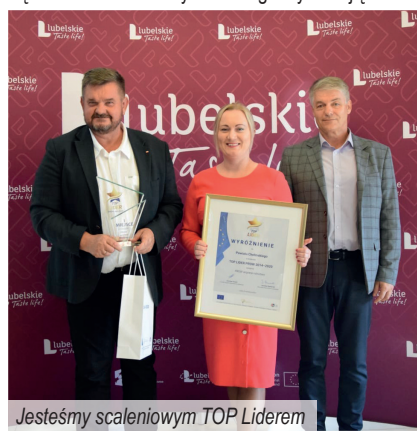
Jesteśmy scaleniowym TOP Liderem