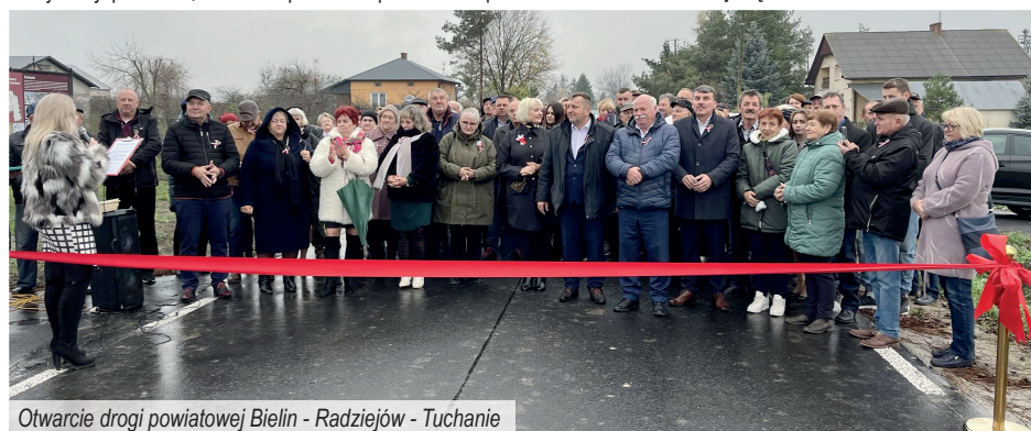
Otwarcie drogi powiatowej Bielin - Radziejów - Tuchanie

Bielin – Radziejów – Tuchanie. Mieszkańcy regionu mogą już bezpiecznie użytkować odcinek, który liczy prawie 4,4 km. Za prawo